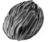
MEDINÚ MACIZO SEMIAMARGO