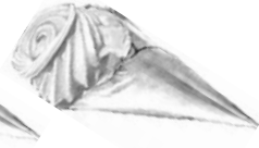
CORNET MACIZO BLANCO