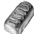
MOUSCADINE MACIZO SEMIAMARGO