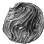
NOBLEZA MACIZA LECHE