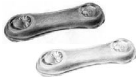
LENGÜITA LECHE LENGÜITA BLANCA