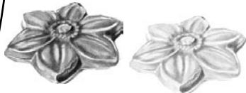
FLORCITA LECHE FLORCITA BLANCA